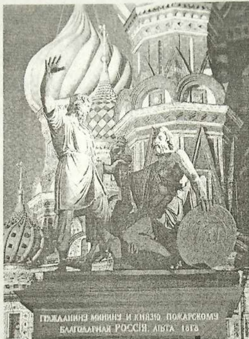
ПОЖАДАНИЕ МИНИНУ И КНЯЗЮ ПОЖАРСКОМУ БЛАГОСЛАВИЯ РОССИИ. ЛИБТА 1678

Минин вдруг оказывается в центре событий. Именно он, вслед за патриархом Гермогеном, высказывает простую и понятную каждому русскому идею о спасении веры и православных святынь. И вокруг этой идеи начинают кристаллизоваться все патриотические силы. В разоренной стране он находит деньги, оружие, провиант и таким образом подводит под все предприятие прочный экономический фундамент. А когда ополчение уже формируется и возникает нужда в военном вожде, на кого обращается взор земских людей? На князя Пожарского! — представителя захудалого и небогатого рода, никогда не игравшего в русской истории значительной роли. Почему же такое предпочтение? Быть может, Пожарский был отмечен какими-нибудь личными достоинствами? Да, отмечен — правда, всего одним, но немаловажным — он был честный служака, никогда не кривил душой и всегда был верен долгу. Во всем остальном он совершенно ординарная личность — не трибун, не блещет способностями и даже полководец довольно посредственный.